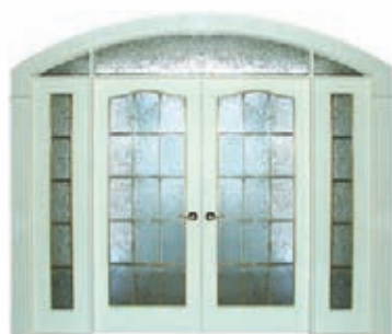
PORTE JUMELLE AVEC LATÉRAUX ET IMPOSTE