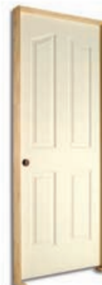
PRÉMONTÉE « SÉRIE R »