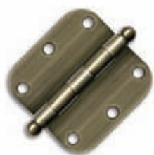
PENTURE (TÊTE RONDE)