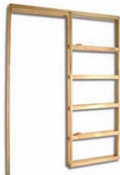
ENSEMBLE ESCAMOTABLE (ROULEMENT À BILLES EN OPTION)