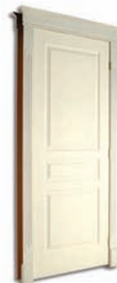
PRÉMONTÉE « SÉRIE 3 MCX »