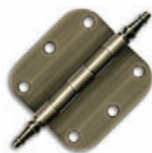
PENTURE (TÊTE CÔNIQUE)